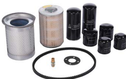
Сервисный набор 2000 часов ET SD