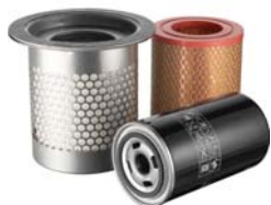
Сервисный набор 2000 часов ET SL