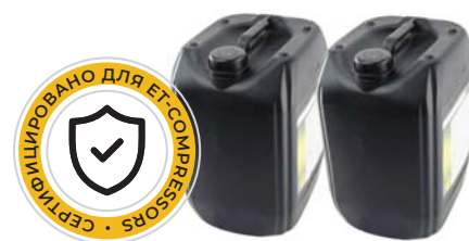
Компрессорное и моторное масла